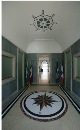
Ingresso e Salone