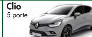
Clio 5 porte

€ 24,00- giorno € 54,00- weekend € 124,00- settimana