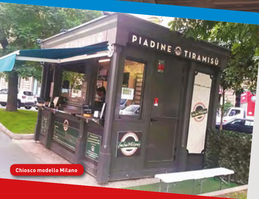
Chiosco modello Milano

VELOCI DA MONTARE INTERAMENTE PERSONALIZZABILI