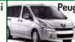
Peugeot 1.6 9 Posti

€ 59,00- giorno € 149,00- weekend € 259,00- settimana