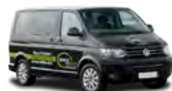
CARAVELLE 9 POSTI DIMEZZA I COSTI, AUMENTA L'ALLEGRIA!