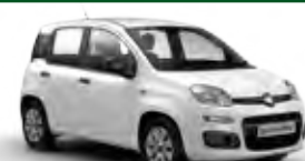
Panda 5 porte

€ 24,00- giorno € 54,00- weekend € 124,00- settimana